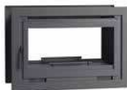
IT-102 FK Interior Fundición Cristales Serigrafiados EAN: 8427561 011849