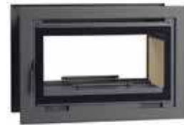
IT-102 F Interior Fundición EAN: 8427561 011832