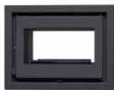
IT-172 FK Interior Fundición Cristales Serigrafiados EAN: 8427561 018282