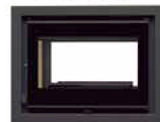
IT-172 F Interior Fundición EAN: 8427561 018275