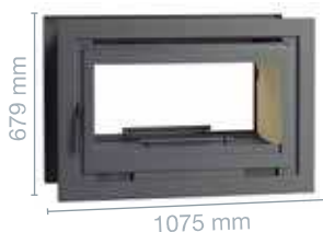
IT-102 K Interior Vermiculita Cristales Serigrafiados EAN: 8427561 011825